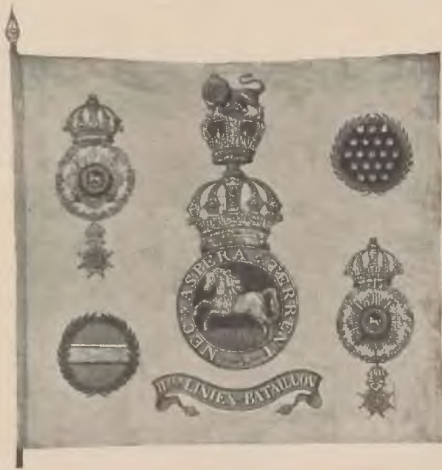
fahne des 11. Linien-Bataillons Lingen 1833 — 1838