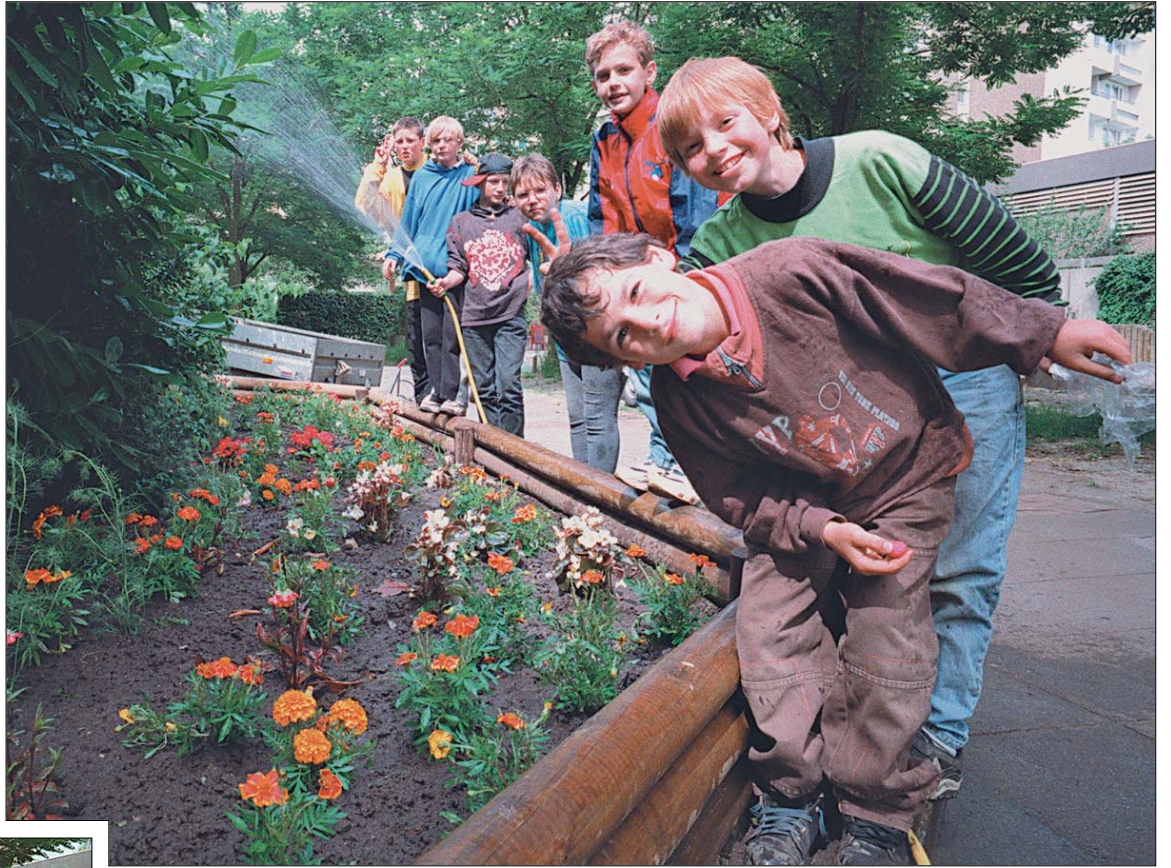
Die Pflanzaktion machte sichtlich Spaß: Kinder legten im Juli das Achteckbeet zwischen den Klingenthal-Hochhäusern an. Die 200 Blumen lieferte das ABM-Projekt „Grünpflege“.

Mal hatte er die Pflanzaktion mitorganisiert. Vergebens jedoch, so Buschmann, sind derlei Aktionen nicht. „Wir konnten auf diesem Wege Kontakt zu Kindern aufbauen, die jetzt unsere normalen Gruppen besuchen“, erklärt der Gemeinwesenarbeiter. Und entmutigt ist Buschmann erst recht nicht: „Man muß sich zwar erst einmal wieder neu motivieren, aber im kommenden Jahr nehmen wir bestimmt einen weiteren Anlauf am Achteckbeet.“