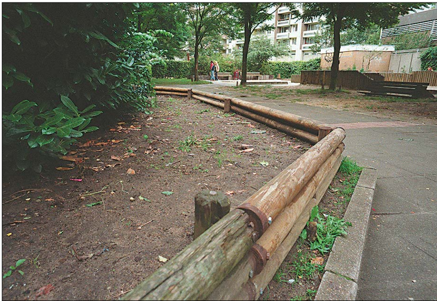
Trauriges Bild: 14 Tage nach der gemeinsamen Pflanzaktion sind alle Blumen herausgerissen, macht das Beet wieder einen trostlosen Eindruck.