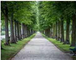
BÄUME UND GRÜANLAGEN MÜSSEN ZUNEHMEND BEWÄSSERT WERDEN

Der Trinkwasserbedarf der Landeshauptstadt Hannover wird zu über 90 % aus Grundwasser gedeckt. Die Gewinnung wird von den Stadtwerken Hannover im Wesentlichen im nördlich der Stadt gelegenen Fuhrberger Feld vorgenommen.