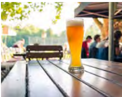
HANNOVERSCHES GRUND- WASSER WIRD U. A. ZUM BIERBRAUEN VERWENDET

Unabhängig von der Trinkwassergewinnung für die öffentliche Wasserversorgung werden innerhalb der Stadtgrenzen jährlich mehrere Millionen Kubikmeter Grundwasser genutzt: zu betrieblichen Zwecken, in der Lebensmittelindustrie (z. B. Brauereien) aber auch zur Bewässerung von Grün- und landwirtschaftlichen Flächen, Sportanlagen, Straßenbäumen, Haus- und Kleingärten. Im Stadtgebiet gibt es außerdem etwa 160 Brunnen, mit denen die Bevölkerung im Katastrophenfall mit Wasser versorgt werden könnte. Im Zuge des Klimawandels wird sich der Wasserbedarf insbesondere in den Sommermonaten weiter erhöhen, so dass Nutzungskonkurrenzen zu erwarten sind.