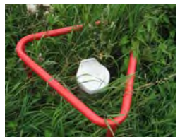
GRUNDWASSERMESSTELLEN IM STADTGEBIET VON HANNOVER

Die digitale Grundwasserkarte und Grundwasserganglinien stehen online unter www.hannover-gis.de zur Verfügung.