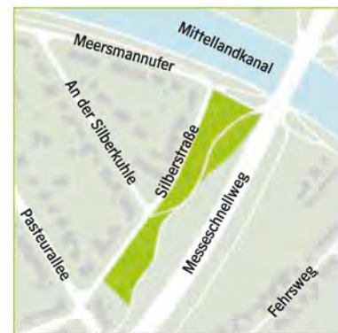
Nordost – Silberstraße