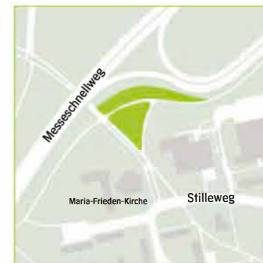
Nordost – Stilleweg