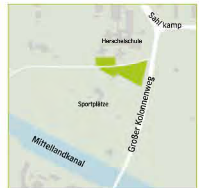
Nord – Großer Kolonnenweg

Für weitere Informationen und Beratung zu den Freundschaftshainen wenden Sie sich bitte direkt an unsere zuständigen Pflegebetriebe (siehe Übersichtskarte) oder per E-Mail an: 67.32@hannover-stadt.de