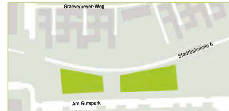
Südost – Am Gutspark