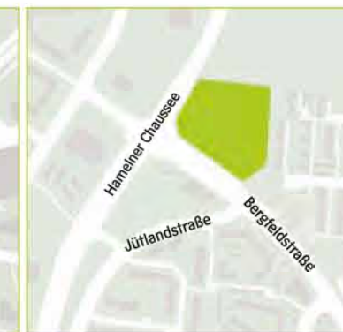
Südwest – Bergfeldstraße/Hamelner Chaussee