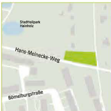
Nord – Hans-Meinecke-Weg