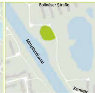
Nordost – Am Großen Kampe/Kampstraße