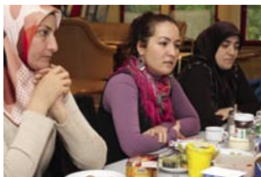
Bei Vorträgen hören alle Teilnehmerinnen konzentriert zu.