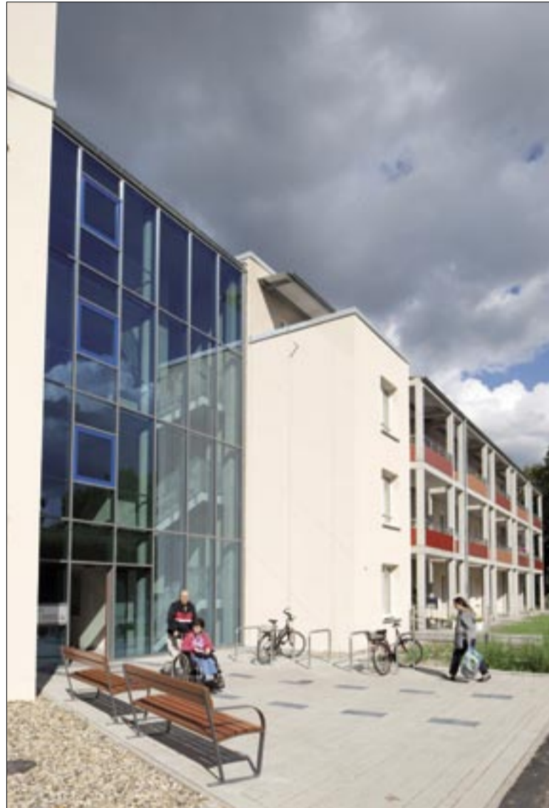
Ein Schmuckstück im Stadtteil: Das Seniorenwohnprojekt Moorhoffstraße

Rund vier Millionen Euro hat die GBH in das Wohnprojekt investiert, die Kaltmiete fällt mit 5,40 Euro pro Quadratmeter sozialverträglich aus. Die Landeshauptstadt Hannover hatte den Abriss von Gebäuden,