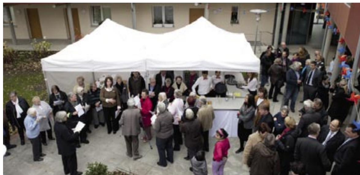
Zur Einweihung war der Innenhof voll: Die BewohnerInnen und zahlreiche Gäste feierten am 23. Oktober gemeinsam vor dem Café.

Zu den Aufgaben von Bechinie gehört vor allem die Beratung von Pflegebedürftigen und deren Angehörigen. Diese Gespräche führt sie nicht nur im Seniorenwohnprojekt sondern auch bei den Betroffenen zuhause. Außerdem vermittelt sie Pflegedienstleistungen der Diakoniestation Herrenhausen und übernimmt Pflegekontrollbesuche. Im Seniorenwohnprojekt nehmen derzeit elf BewohnerInnen die Leistungen der Diakoniestation in Anspruch, darunter einige, die schon vor dem Einzug von den MitarbeiterInnen der Diakoniestation gepflegt wurden.