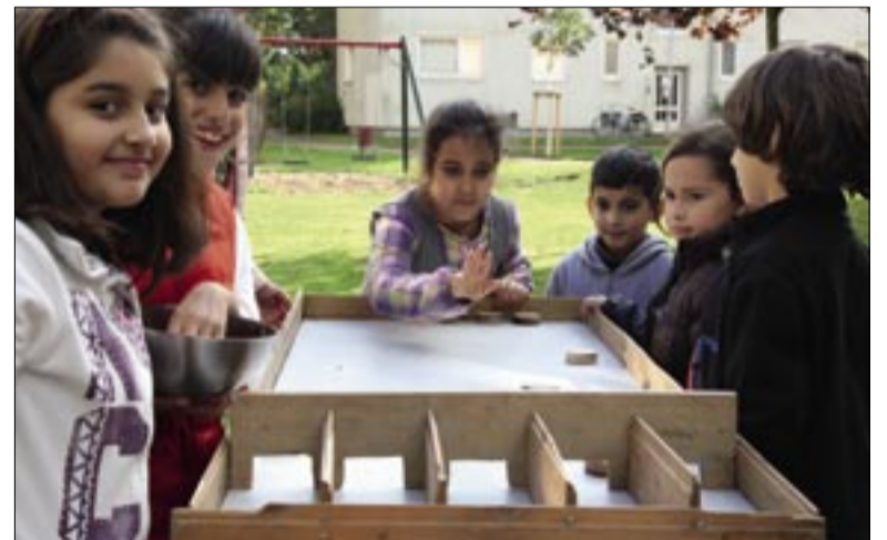
Auf dem diesjährigen Stadtteilladenfest Ende September herrschte gute Laune: Es gab Kaffee, Tee, kalte Getränke und Kuchen sowie jede Menge Spielangebote für die Kinder.