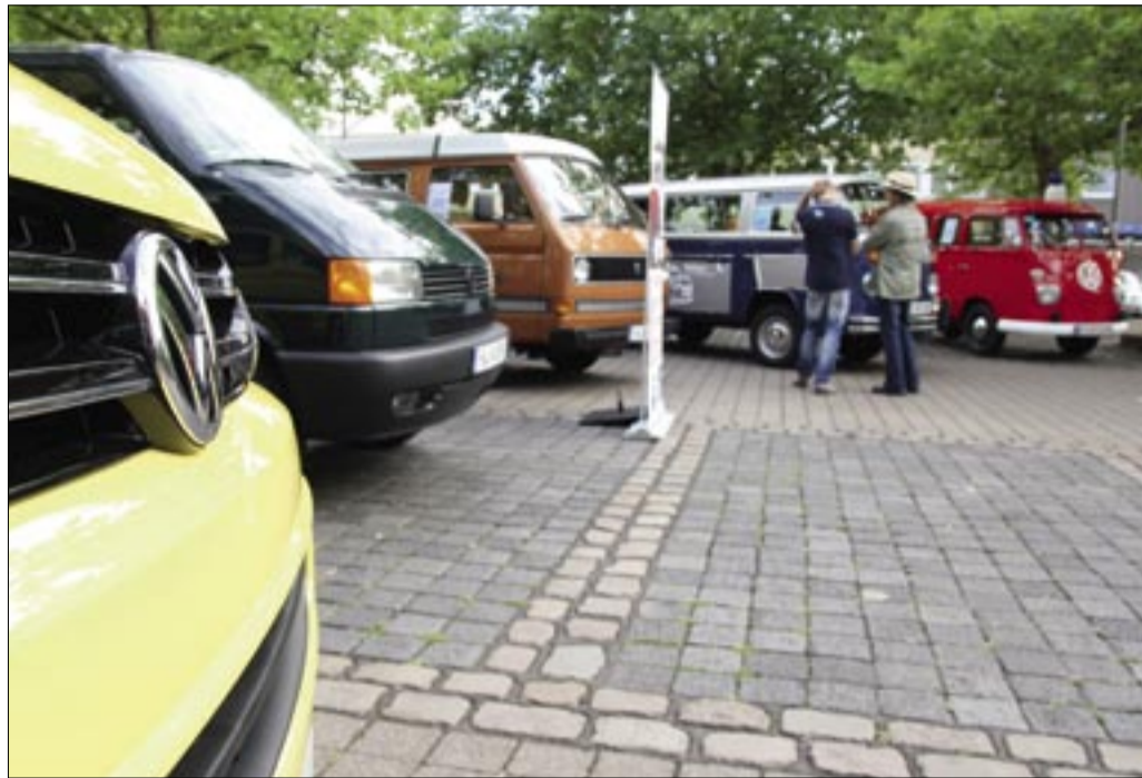
Fünf Generationen „Bullis“: VW-Nutzfahrzeuge ließ die Erfolgsgeschichte des Transporters Revue passieren.

Die Gewerbetreibenden hatten auch organisiert, dass VW Nutzfahrzeuge auf