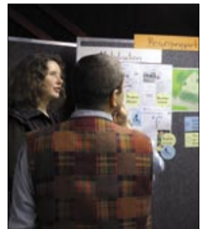
Die Info-Veranstaltung Ende November im Freizeithaus stieß auf großes Interesse.

Ende November wurden die Planungen einer Arbeitsgruppe, in der BewohnerInnen, Mitglieder der Sanierungskommission Stöcken und der Verwaltung sowie das beauftragte Büro für Freiraumplanung Christine Früh mitgewirkt hatten, auf einer Veranstaltung im Freizeithaus Stöcken vorgestellt. Die Sanierungskommission befand vor wenigen Tagen über eine entsprechende Drucksache. Der Bau des Bewegungsparks ist für kommendes Jahr geplant. Insgesamt stehen für das Vorhaben 160.000 Euro aus Mitteln der Städtebauförderung zur Verfügung.