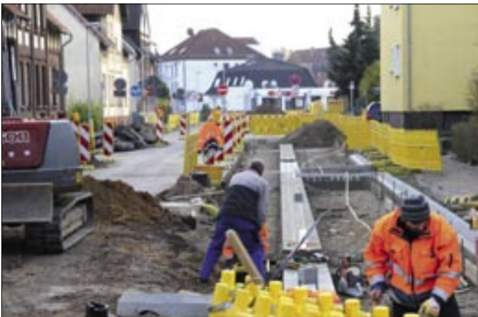
Während der Bauarbeiten war ein Teil der Freudenthalstraße nur eingeschränkt zu befahren.

ßenbildes bei. Die Sanierung der Straße kostete rund 1,4 Millionen Euro und wurde aus städtischen Mit- teln sowie aus dem Bund-Länder- Programm „Soziale Stadt“ finan- ziert.