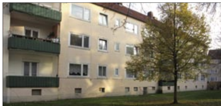
Die Fassaden der Häuser Hogrefestraße 9-11 werden kommendes Jahr gedämmt.

GBH den bisherigen Modernisierungen in der Weizenfeldstraße und in der Ithstraße zugrunde gelegt hatte: Die Außenwände werden farbig angestrichen und die Fensterbänder sich davon in einer anderen Farbe abheben. Größere Beeinträchtigungen werden während der Bauphase aber nicht auf die BewohnerInnen zukommen, versichert Ursula Schroers, GBH-Geschäftsstellenleiterin in Vahrenheide.