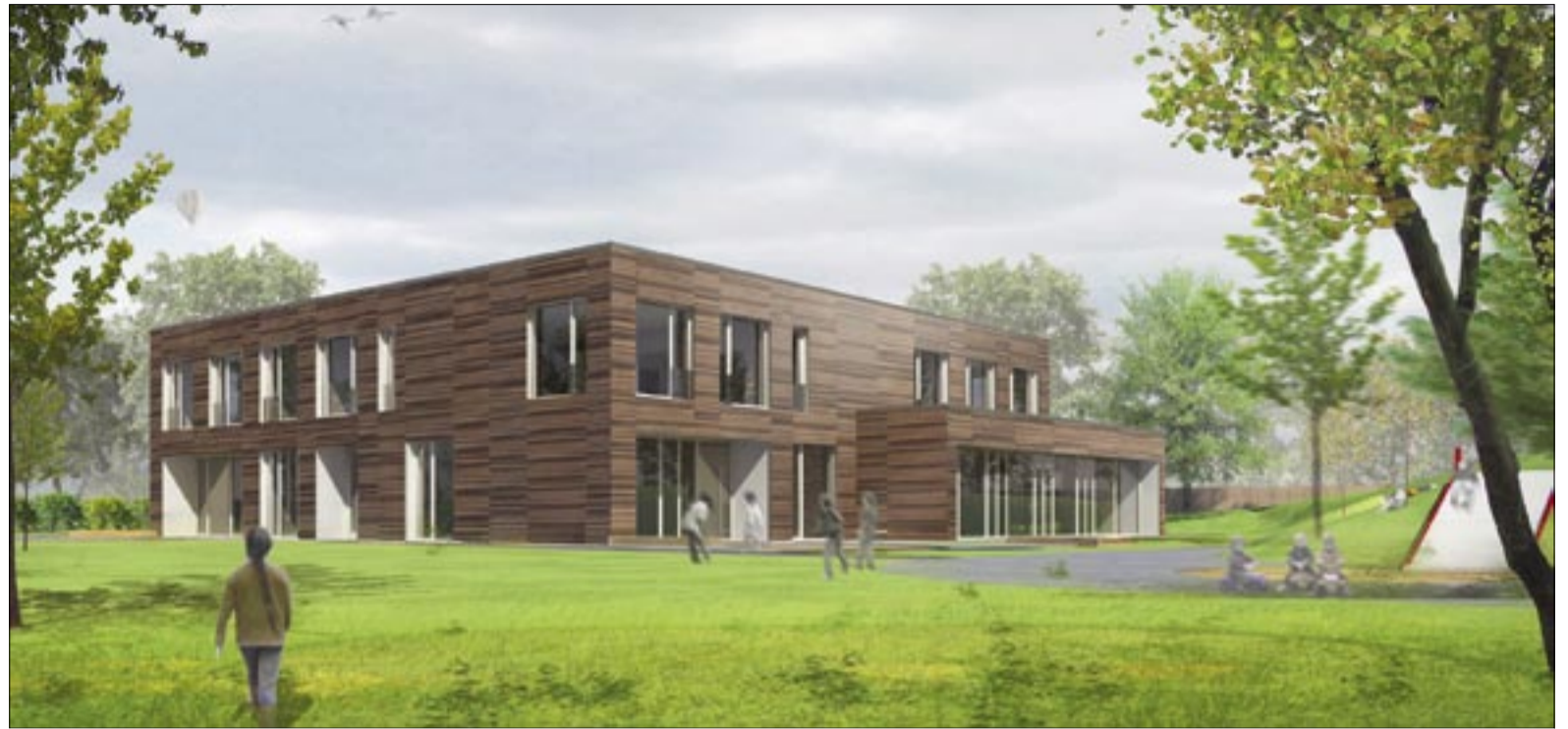
Moderne Architektur gepaart mit hohem energetischen Standard: Die neue Kita wird Platz für insgesamt bis zu 95 Kinder im Krabbelgruppen- und Kindergartenalter bieten.

Die Kindertagesstätte in Stöcken entsteht in der Hogrefestraße, nur wenige Schritte vom Stöckener Bad entfernt. Baustart war im vergangenen Mai, die Fertigstellung ist für April kommenden Jahres geplant. Wenig später soll die Einrichtung in Betrieb genommen werden. Vorgesehen sind drei Krippengruppen für insgesamt 45 Kinder sowie zwei Kindergartengruppen für bis zu 50 Kinder, davon wird eine integrativ arbeiten. Die Räumlichkeiten für die Gruppen befinden sich in einem villenähnlichen, frei stehenden Gebäude, das von einem großen Freigelände umgeben ist und viele Spielmöglichkeiten bietet. Weitere Informationen, unter anderem über Anmeldungen von Kindern, erteilt das Familien-ServiceBüro der Stadt Hannover unter der Rufnummer (05 11) 16 84 35 35.