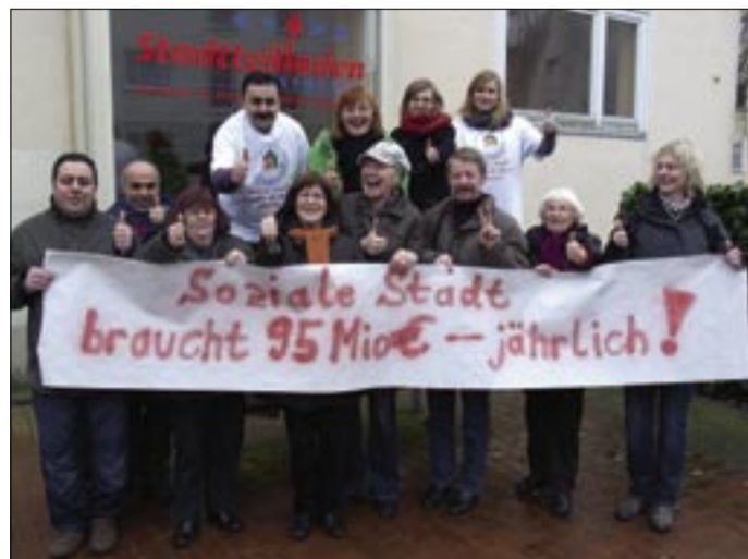
Die Mitglieder der Initiative HISS setzen sich für mehr Bundeszuschüsse ein.

auf 40 Millionen Euro erhöht, für kommandes Jahr wurde derselbe Betrag in den Haushalt eingestellt. Wer sich HISS anschließen möchte, kann sich an SPATS e.V., den Dachverband verschiedener Einrichtungen in Hannover, wenden. Die Rufnummer lautet (05 11) 70 03 58 53.