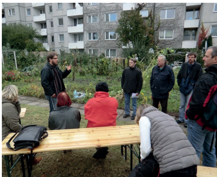
12:45 Uhr abschließende Besichtigung und Information im Stadtteilgarten Spessartweg