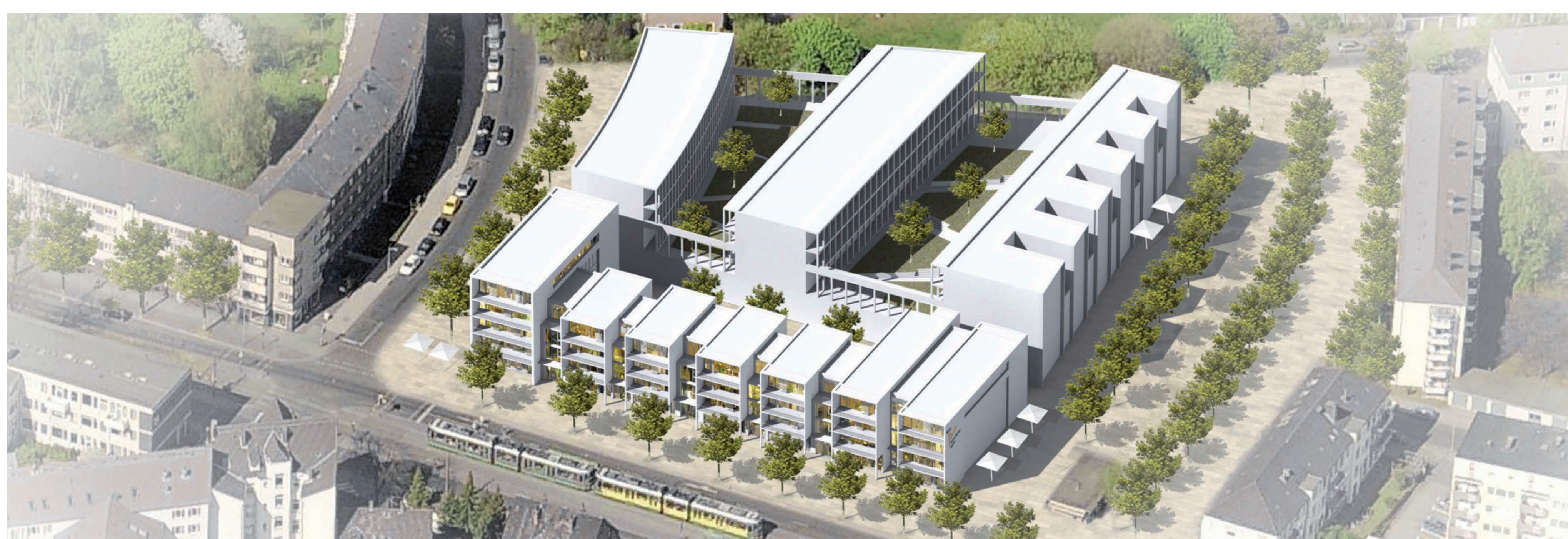
Vogelschau von Südwesten