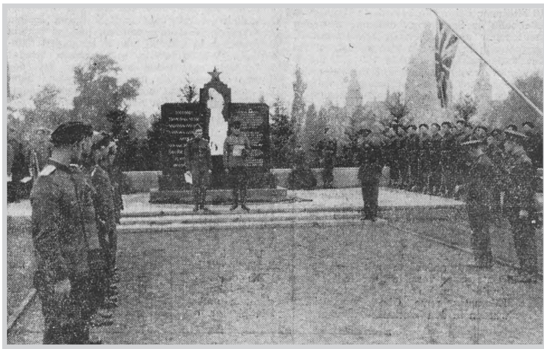
Einweihung des mit einem Sowjetstern bekrönten Mahnmals am 16. Oktober 1945.