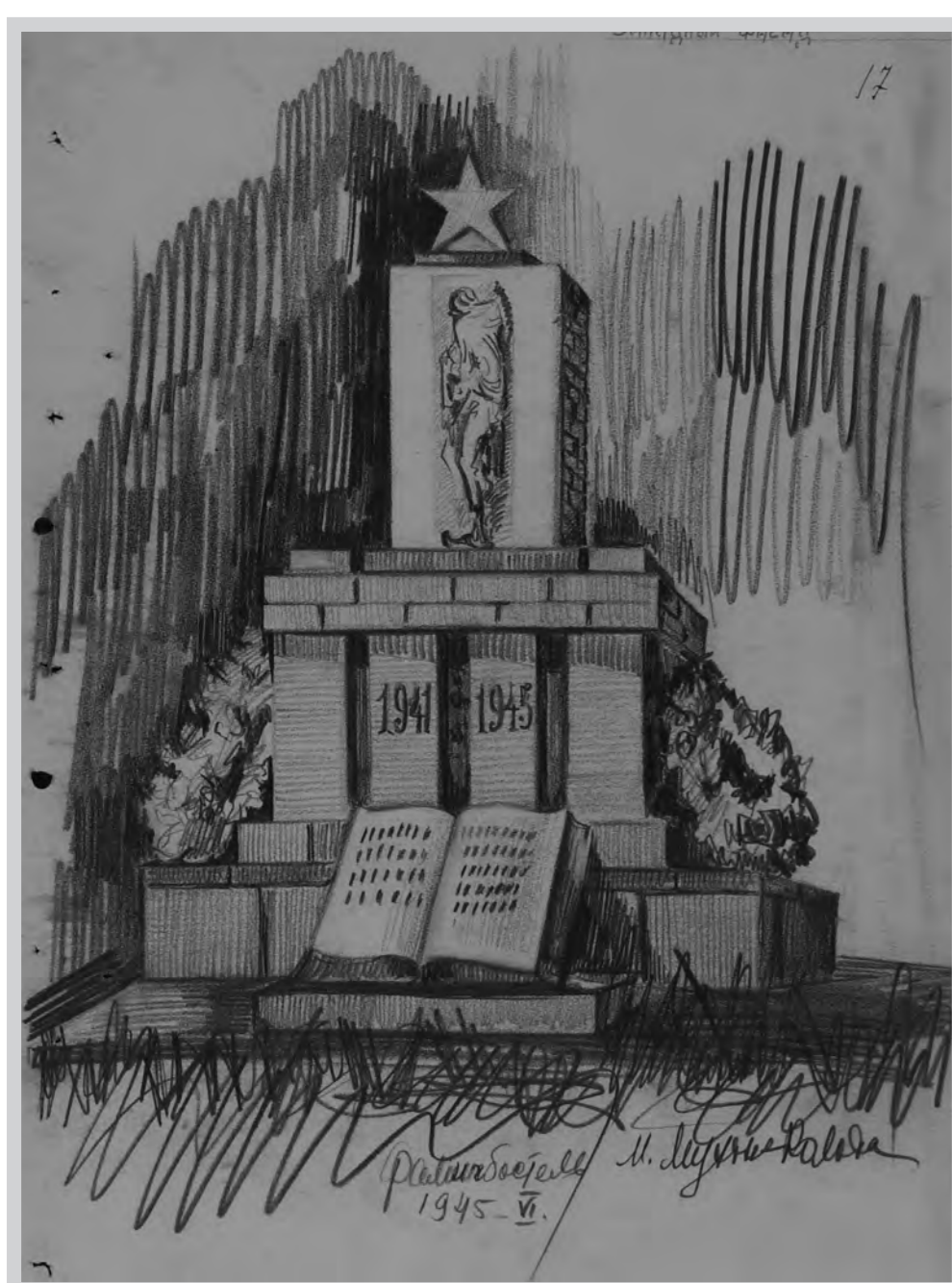
Zeichnung Muchins für das am 3. Juli 1945 eingeweihte Mahnmal auf dem sowjetischen Kriegsgefangenenfriedhof Oerbke.

Die Stadt trug die Kosten für den Gedenkstein und die gärtnerische Gestaltung des Friedhofs. Am 16. Oktober 1945 fand die feierliche Einweihung statt.