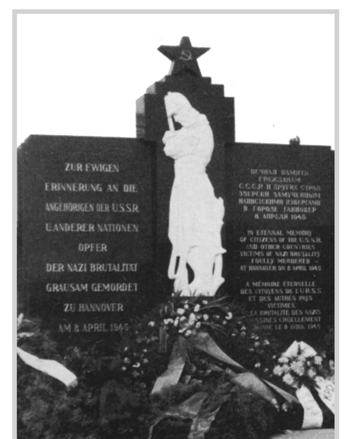
Denkmal Maschsee-Nordufer (Ausschnitt), 1947

Столица земли Нижняя Саксония г.Ганновер, 2010 г. Обер-бургомистр