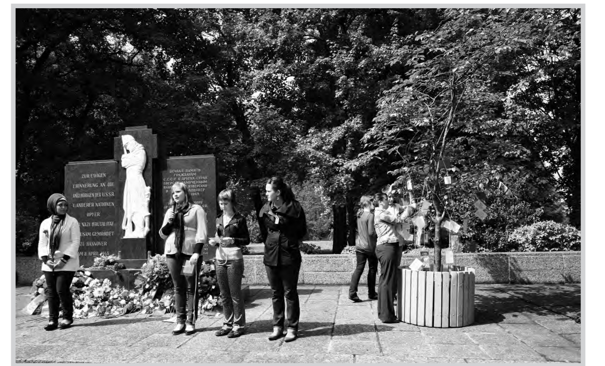
Feierliche Erinnerung am 8. Mai 2009 mit Schülerinnen und Schülern aus Mordowien/Russland und der Heinrich-Heine-Schule/Hannover.

Погибшие узники концлагерей, подневольные работники и военнопленные из Советского Союза и других europäischen стран были по распоряжению британских военных властей достойно перезахоронены на северном берегу Машзее – на том месте, откуда была видна Новая Ратуша. Первой группой жертв, которую удалось identifizieren, были советские военнопленные, расстрелянные 6 апреля 1945 г. на городском кладбище Зеельхорст. Видимо поэтому проектирование и возведение памятника было поручено Советскому штабу по репатриации. Штаб решил использовать шведский гранit und silезский камень für die нижнего цоколя памятника; фигура солдата должна была быть выполнена из мрамора. Надпись на памятнике была составлена совместно с британскими военными властями. Текст на немецком языке на доске слева было решено выделить особо как напоминание и предостережение. Дата, указанная в тексте – ошибочная. В начале 1980-х гг. историками была установлена точная дата расстрела – 6 апреля 1945 г. Городские власти г.Ганновера оплатили памятник и садово-парковое оформление кладбища. Его торжественное открытие состоялось 16 октября 1945 г.