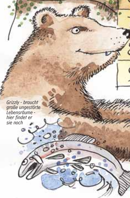
Grizzly - braucht große ungestörte Lebensräume - hier findet er sie noch