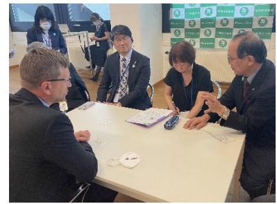
Treffen mit Regierungsvertretern verschiedener Länder (Juni 2022 in Wien)