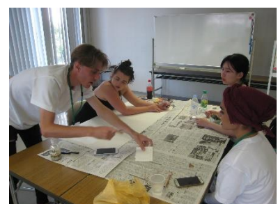
Diskussion von Jugendlichen aus den Mitgliedsstädten beim Jugendaustauschprojekt „Hiroshima und der Frieden“, das von den Bürgermeistern für den Frieden unterstützt wird (August 2019 in Hiroshima)