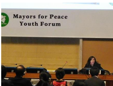
Rede eines Jugendlichen aus einer Mitgliedsstadt bei dem Jugendforum, veranstaltet von den Bürgermeistern für den Frieden im Büro der Vereinten Nationen in Genf (April 2018 in Genf)