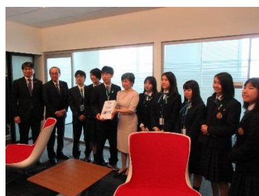
Oberschüler*innen, die an der Unterschriftenaktion teilgenommen haben, überreichen diese an Vertreter*innen der Vereinten Nationen (April 2019 in New York)