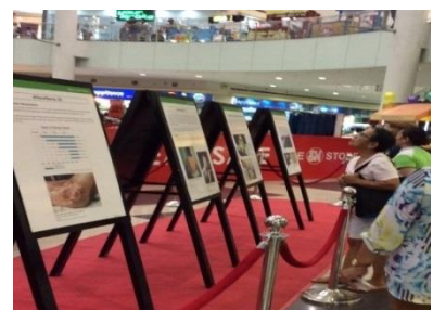
Veranstaltung einer Posterausstellung der Bürgermeister für den Frieden zum Thema „Atombomben“ in einer Mitgliedsstadt (Juni 2015 in Muntinlupa, Philippinen)