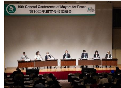
10. Generalversammlung (Oktober 2022 in Hiroshima)

Die Mitglieder der Bürgermeister für den Frieden versammeln sich prinzipiell alle vier Jahre einmal zu einer Generalversammlung, die abwechselnd in Hiroshima bzw. Nagasaki stattfindet. Unter Beteiligung der Mitgliedsstädte werden wichtige Angelegenheiten der Organisation entschieden und genehmigt.