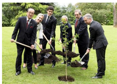
Feierliches Einpflanzen eines Setzlings, der von Bäumen, die die Atombomben überlebt haben, abstammt (April 2018 in Gernika-Lumo)