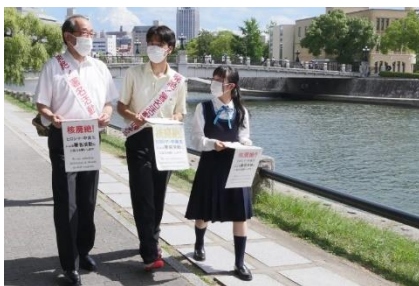
Unterschriftensammlung auf der Straße durch den Präsidenten und Oberschüler*innen (August 2022 in Hiroshima)