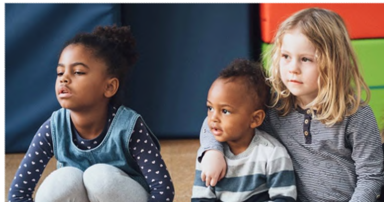
Integration und interkulturelles Lernen