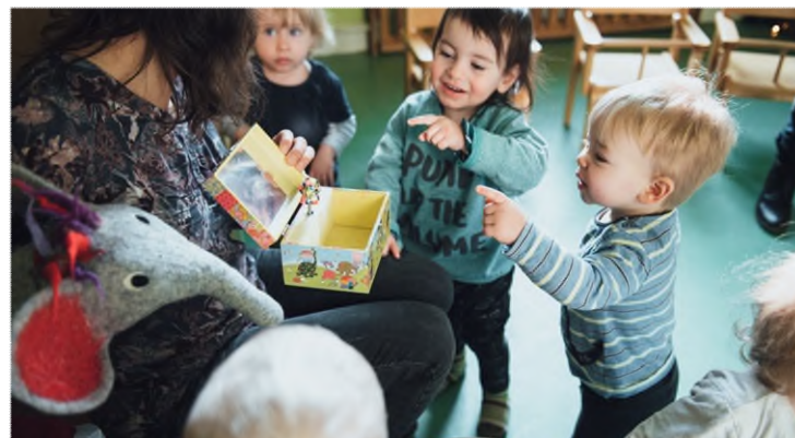
Lärmprävention & Förderung von Achtsamkeit