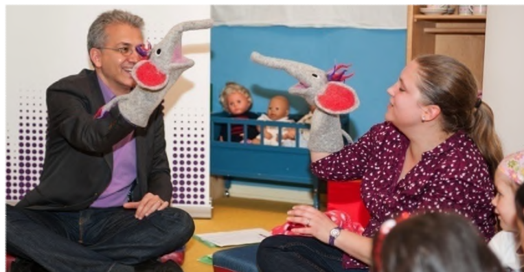
Zusammenarbeit mit Familien