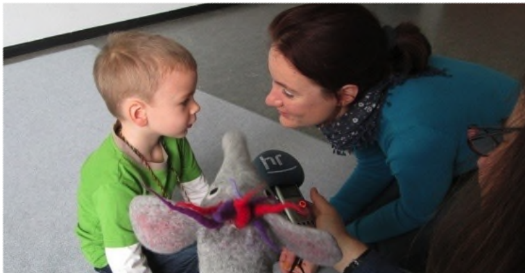
Zuhör-, Sprach- und Medienbildung