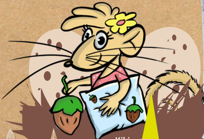
Kiki, die Haselmaus

„Eigentlich bin ich gar keine Moorbewohnerin. Aber als Haselmaus lebt es sich heute auch nicht leicht. Überall Straßen, Häuser und Äcker. Wo soll man da einen Platz zum Schlafen finden? Darum bin ich mit Sack und Pack ins Moor umgezogen. Anfangs war das ganz schön ungewohnt, aber zum Glück habe ich Yorck getroffen. Der kennt von Neustadt bis Altwarmbüchen jedes Wasserloch! Mit Yorck zusammen erlebe ich jeden Tag etwas Neues. Wir treffen kriminelle Elstern und verrückte Moormaler, einen verfressenen Kranich und viele andere ulkige Typen. Langweilig wird das nie und nebenbei lerne ich eine Menge über das Moor.“