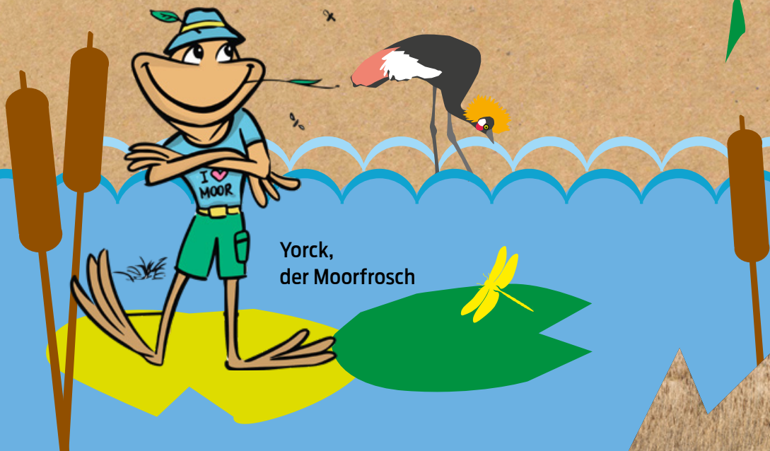
Yorck, der Moorfrosch

Oder musstet ihr schon mal vor einer hungrigen Kreuzotter fliehen und mit einem schlecht gelaunten Torfmoos diskutieren? Brrrh, ich kann euch sagen! Und dann der große Moorbrand - wenn ich als Chef der Froschfeuerwehr damals nicht ... Aber das könnt ihr euch alles selbst anhören, in unseren spannenden und lustigen Hörspielen!“