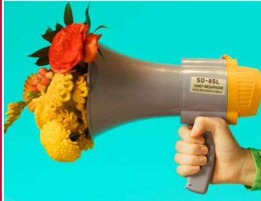
Fit gegen Stammtischparolen