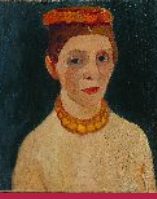
13. Modersohn-Becker, Paula, Selbstbildnis mit rotem Blütenkranz und Kette, 1906-07 © Landesmuseum Hannover

Was macht eigentlich ein Museum? Gemeinsam mit dem Kulturbüro Südstadt könnt ihr das Landesmuseum Hannover kennenlernen und dabei selbst kreativ werden. Am 1. Termin findet im Kulturbüro eine Porträt-Werkstatt statt. Wir schauen uns dazu Bilder der Künstlerin Paula Modersohn-Becker an: Sie zeigte sich besonders gerne mit Blütenkranz im Haar. In der Werkstatt malen wir eigene Selbstporträts. Beim 2. Termin besuchen wir gemeinsam die Sonderausstellung „Ich werde noch etwas. Paula Modersohn-Becker in Hannover“ im Landesmuseum und werden im Anschluss wieder selbst kreativ.