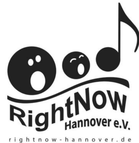
Donnerstags Urheber: Chor RightNow

Veranstalter*in: Stadtbibliothek Misburg