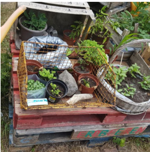
Mittwochs Urheber: Kulturbüro Misburg-Anderten

Anmeldung und weitere Infos: www.musikschule-hannover.de