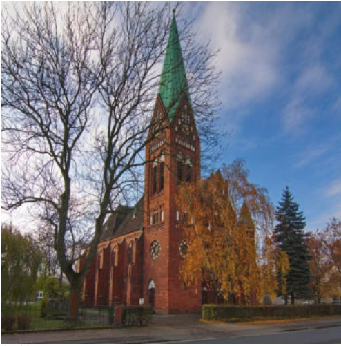
17.12. Urheber: Von Losch