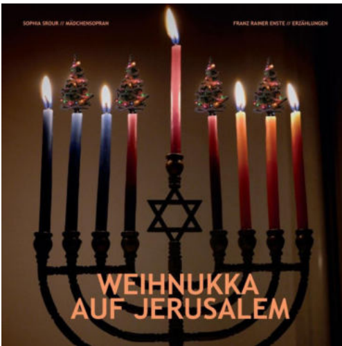
14.12. Urheber: Kolumbarium Herz Jesu

Ort: Vor der Begegnungsstätte Anderten, Walter-Clemens-Platz 1 Veranstalter*in: Arbeiterwohlfahrt Region Hannover e.V.