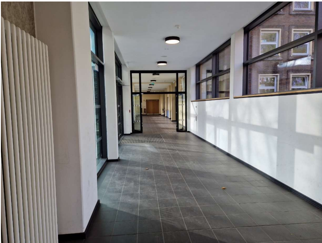
Flur vom Eingang Wißmannstraße in Richtung Mensa/Messe.