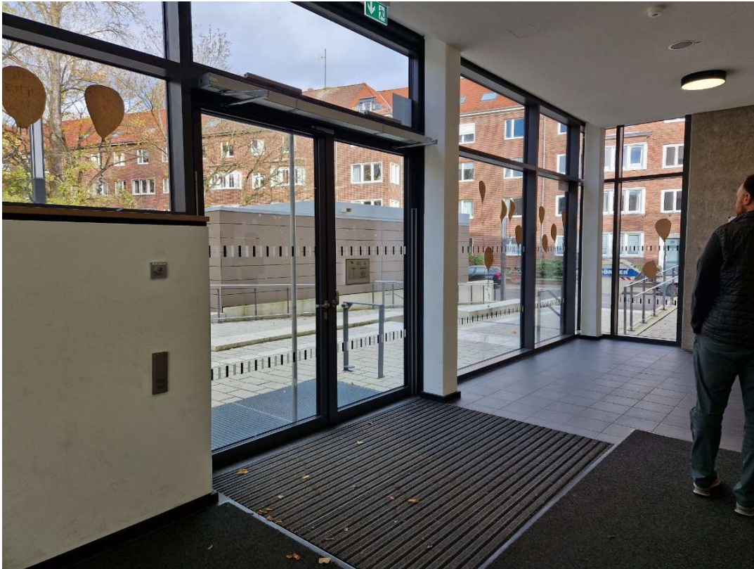
Zugang über Eingang Wißmannstraße. Von hier aus sind die Workshopräume im 1. und 2. OG über das Treppenhaus erreichbar.