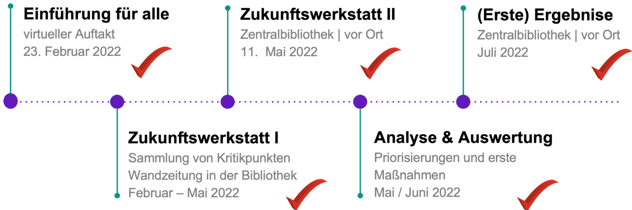
Abb. 1: Die Zukunftswerkstatt 8 im Überblick

greift die Stadtbibliothek Hannover in einem vielschichtigen internen wie externen Beteiligungsprozess seit Anfang 2022 auf. Damit setzt sie Vorgaben aus dem Kulturentwicklungsplan um: „Für die zentrale Stadtbibliothek, ein bereits jetzt stark frequentierter Arbeits-, Lern- und Aufenthaltsort, wird ein Gesamtkonzept für eine zeitgemäß inhaltliche und räumliche Ausgestaltung entwickelt.“ 3