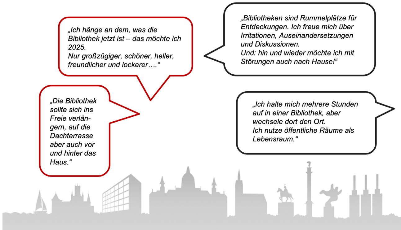
Abb. 6: Zitate aus den Fokusgruppen