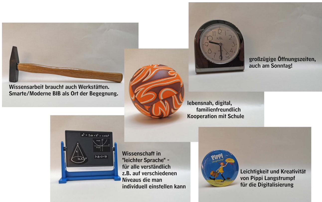
Abb. 3: Erste Ergebnisse von Kund*innenwünschen, Quelle: Stadtbibliothek Hannover