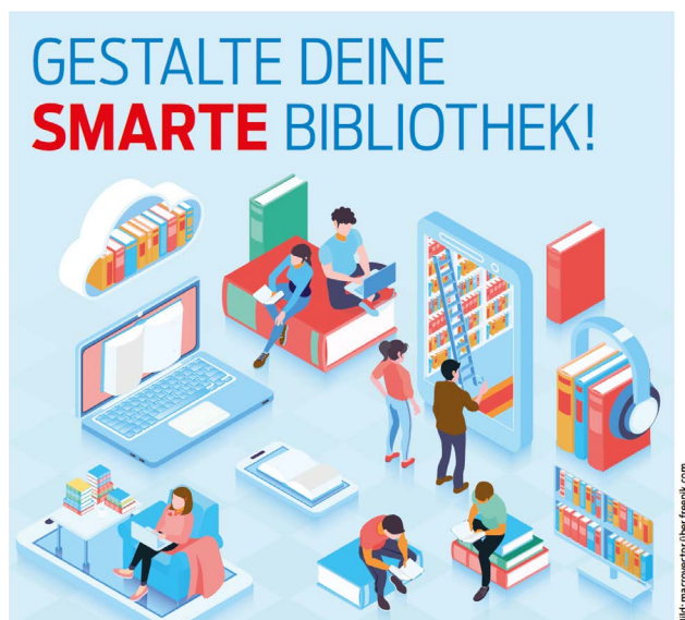
Abb. 5: Aufruf zum Mitarbeiten