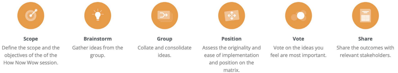
Abb. 7: beispielhafte Schritte des How-Now-Wow-Ciao-Verfahrens 33

passend. [...] Partizipation ist immer konfliktträchtig, die Interessen sind fast immer unterschiedlich verteilt und nicht immer gibt es Lösungen, die alle Interessen tragen.“ 28 Dies gilt namentlich dann, wenn nicht deutlich ist, welche Entscheidungsbefugnis tatsächlich an die Partizipierenden abgegeben wird. Neben der stetigen Rückkoppelung einzelner Prozessschritte ist es wichtig, als einladende Institution zu wissen, welche Spielräume vorhanden sind. Ausgehend von der oft zitierten „Ladder of citizen participation“ nach Sherry R. Arnstein 29 bewegt sich die Stadtbibliothek in dem beschriebenen Prozess zwischen Konsultation/Beratung – nach Arnstein eher der Kategorie ‚Scheinbeteiligung‘ zugeordnet – und Partnerschaft, die der Kategorie ‚Bürgermacht‘ und damit echter Beteiligung zugewiesen wird. „Macht manifestiert sich als Gestaltungsmacht am konkreten Ergebnis“, 30 und diese konkreten Ergebnisse gilt es nun aus den vorliegenden internen wie externen Aussagen herauszuarbeiten und in eine Umsetzung zu bringen.